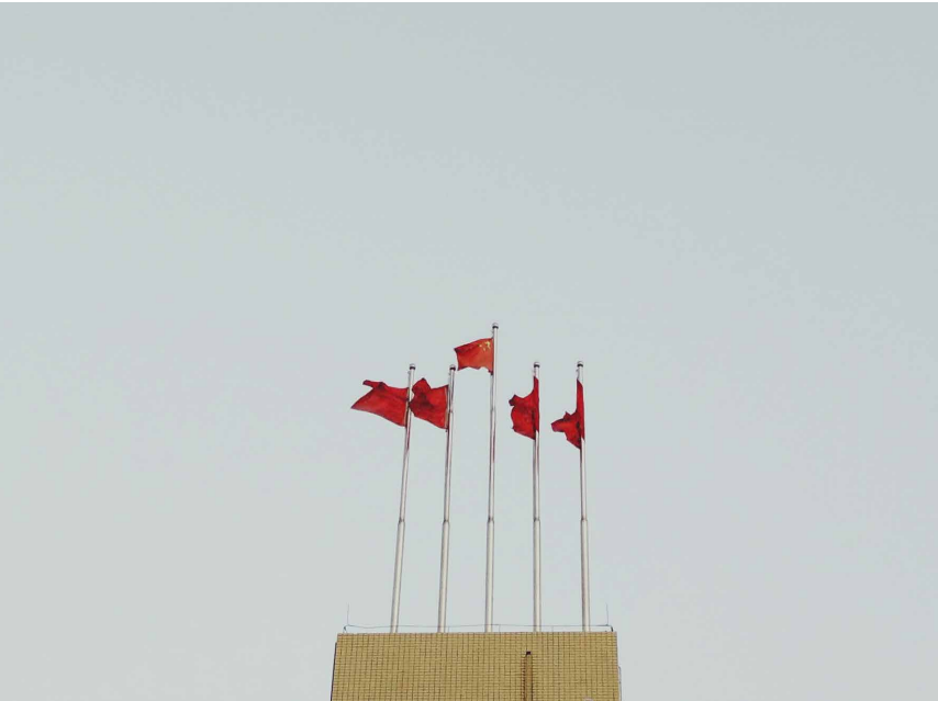
In der Volksrepublik China entstehen eine Vielzahl an Richtlinien zur Unternehmensverantwortung.